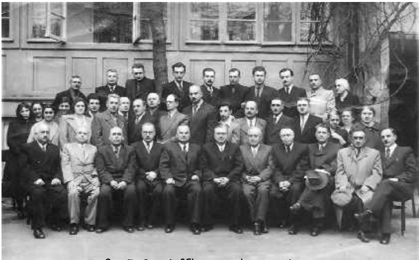
ეკონომიკის ინსტიტუტის კოლექტივი

სულ ახლახან, გუშინ, კვირას, 26 მარტს, დღის 11 სთ-ზე დამირეკა აკად. გ.წერეთელი. ახლა ის ი. ბოლოძის ნაცვ- ლადაც მუშაობს აკადემიაში. მითხრა, ჩემთან შემოიარეო. მივედი მასთან ბინაში. წინა დღეებში ჩვენთან მოსკოვიდან ჩამოვიდნენ სსრკ მეცნიერებათა აკადემიის პრეზიდენტი, კელდიში, თავისი თანმხლები პირებით, რომელთა შორის იყო აკად. ნ.პ. ფედორენკო, ეკონომისტად აღიარებული ინჟინერი, რომელსაც ახლა ამ სფეროში დიდი გავლენა აქვს. გ.წერეთელი ჯერ კიდევ ადრე აწრიალდა.